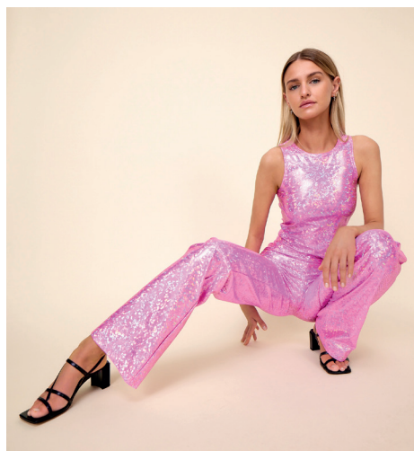
Vores pinke glitterset, i forskellige poses